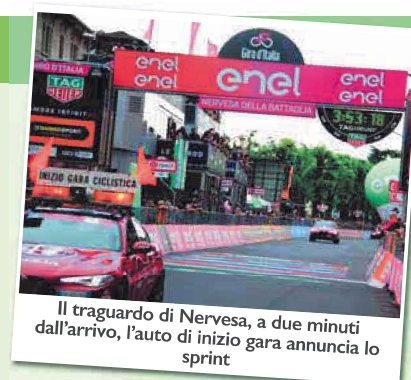
Il traguardo di Nervesa, a due minuti dall'arrivo, l'auto di inizio gara annuncia lo sprint