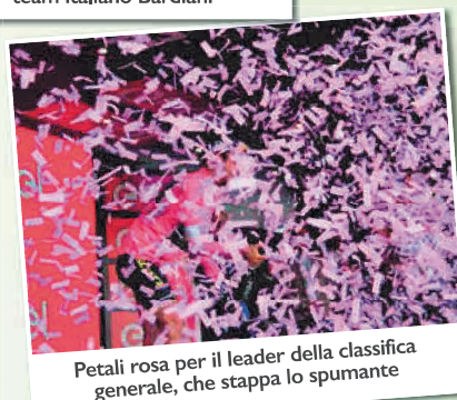
Petali rosa per il leader della classifica generale, che stappa lo spumante