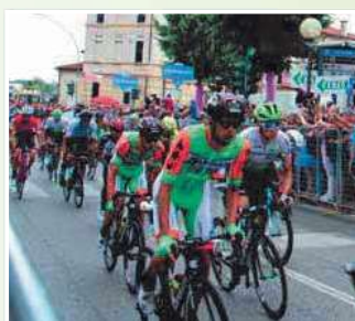
Il passaggio del gruppo in Piazza a Nervesa. In primo piano, gli atleti del team italiano Bardiani