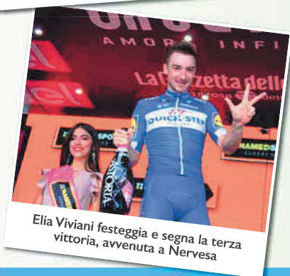
Elia Viviani festeggia e segna la terza vittoria, avvenuta a Nervesa