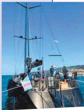
una delle barche a vela in gara, con l'equipaggio a bordo